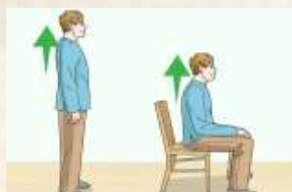
آموزش وضعیت قامتی صحیح