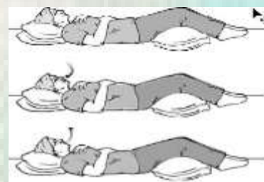
تمرین تنفسی دیافراگمی

مراحل اجرا تمرینات تنفسی لب غنچه ای شامل: